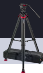
System aktiv8T flowtech75 GS S2068T-FTGS