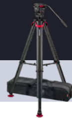
System aktiv8T flowtech75 GS S2068T-FTGS