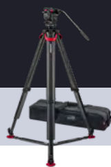
System aktiv6 flowtech75 GS S2064S-FTGS