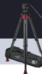
System aktiv10 flowtech100 S2072S-FT