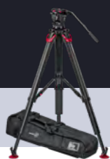
System aktiv10 flowtech100 MS S2072S-FTMS