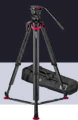
System aktiv10 flowtech100 GS S2072S-FTGS